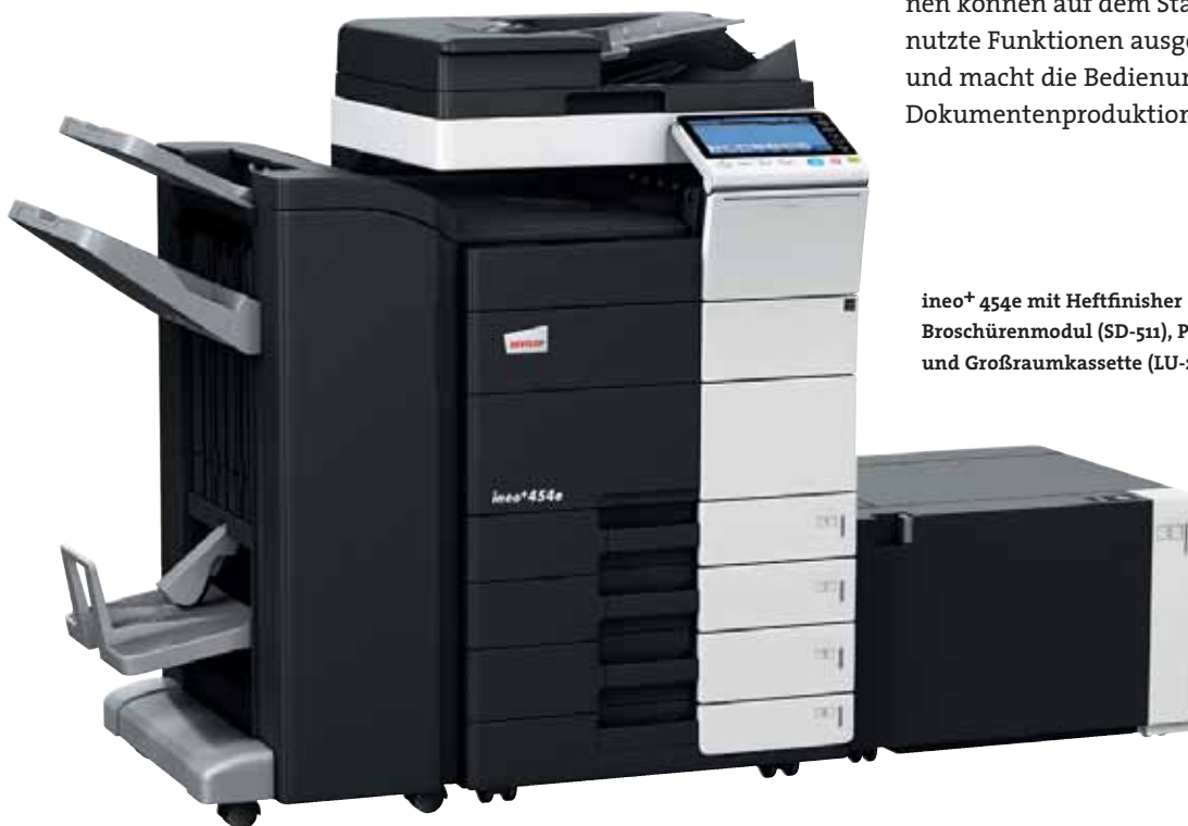
ineo + 454e mit Heftfinisher (FS-534), Broschürenmodul (SD-511), Papierkassette (PC-210) und Großraumkassette (LU-204)

Viele Multifunktionssysteme sind alles andere als anwenderfreundlich. Doch damit ist nun Schluss – die ineo + 454e ist für Ihre Anforderungen wie geschaffen. Das Bedienungskonzept ist intuitiv erfassbar und genauso leicht verständlich wie das eines Smartphones oder Tablet-PCs. Der kapazitive 9 Zoll-Touchscreen verfügt über vertraute Funktionen wie flick, drag&drop und pinch in&out, sodass die Bedienbarkeit ganz einfach ist. Und dank der neuen Menüstruktur lassen sich alle Funktionen auf einen Blick erfassen und die gewünschten Einstellungen mit nur wenigen Berührungen vornehmen. Ein weiterer Vorteil: Regelmäßig genutzte Funktionen können auf dem Startbildschirm abgelegt, ungenutzte Funktionen ausgeblendet werden. Das spart Zeit und macht die Bedienung kinderleicht. Einfacher ist Dokumentenproduktion noch nie gewesen!