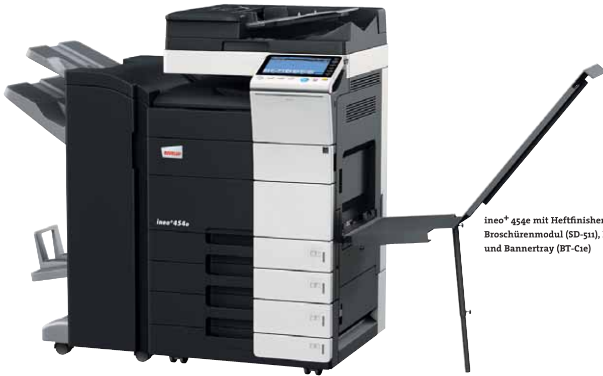
ineo+ 454e mit Heftfinisher (FS-534), Broschürenmodul (SD-511), Papierkassette (PC-210) und Bannertray (BT-C1e)