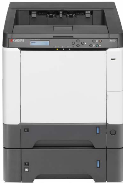
Abb. mit Option