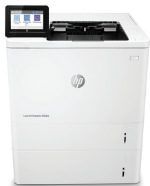
HP LaserJet Managed E60065x